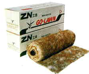
あも青ゴーローン

あも青の植付適期は、4月下旬から7月中旬です。適期以外の施工について、当社は一切の責任を負いかねます。栽培面積に限りがあります。早めにご予約ください。